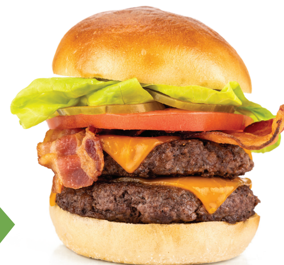
Cheeseburger Double au Bacon

BURGER AU POULET CÉSAR 16,99 Poitrine de poulet frit assaisonné et croustillant garnie de bacon, de fromage parmesan et de vinaigrette César, servie sur un pain au beurre à l'ail.