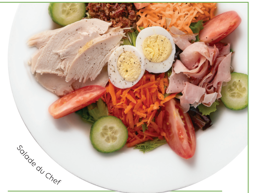
Salade du Chef

SALADE DU CHEF 17,99 Mélange de légumes avec de la dinde, du jambon émincé, du bacon, un œuf cuit dur, des concombres, des tomates, des carottes râpées et du fromage.