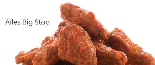
Ailes Big Stop

AILES BIG STOP 17,99 Votre choix de saveurs : Buffalo, BBQ, miel et ail, sauce chili douce ou sel et poivre. Servies avec des carottes, des céleris et de la trempette ranch.