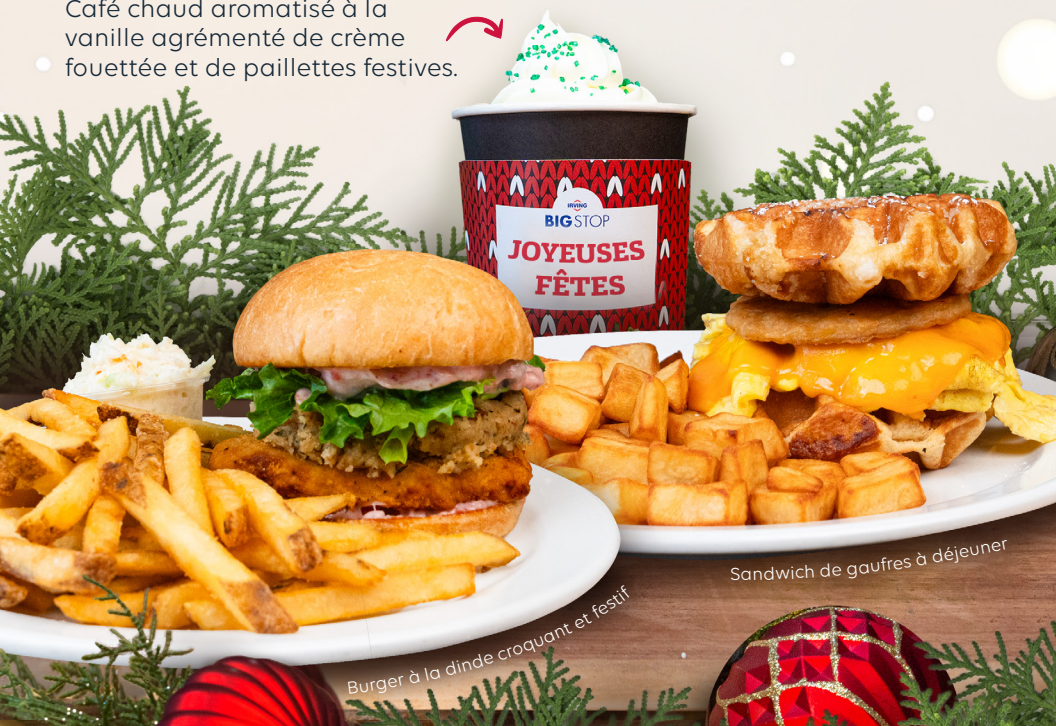
Burger à la dinde croquant et festif

Deux œufs brouillés garnis de cheddar fondu et de saucisse, bacon ou jambon, entre deux gaufres belges grillées et saupoudrées de sucre à glacer. S'accompagne de sirop de table et de pommes de terre rissolées bien dorées.